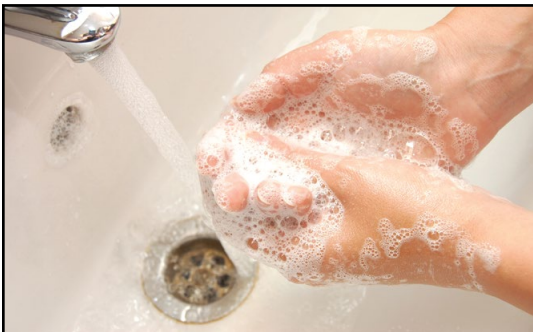
Yeej zoo rau koj hais “Thov ntxuav koj txhais tes!” los yog “Koj puas tau ntxuav koj txhais tes?”