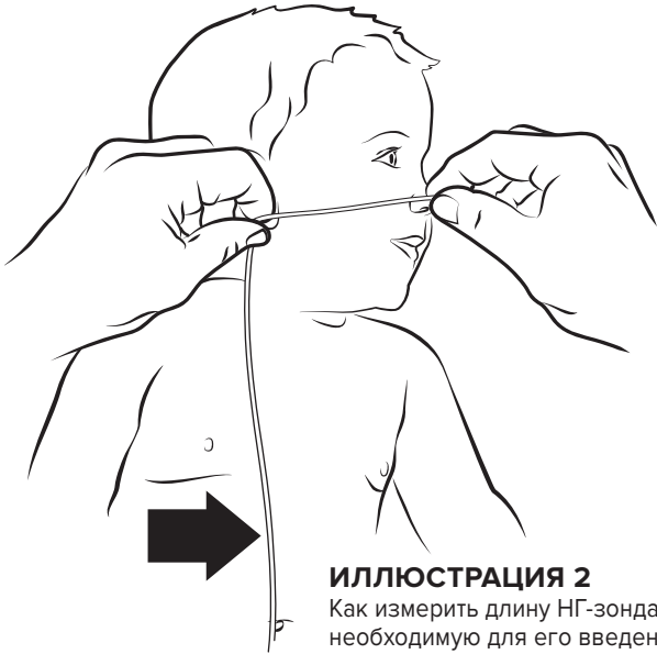
ИЛЛЮСТРАЦИЯ 2 Как измерить длину НГ-зонда, необходимую для его введения; стрелка указывает место, где необходимо поставить отметку.