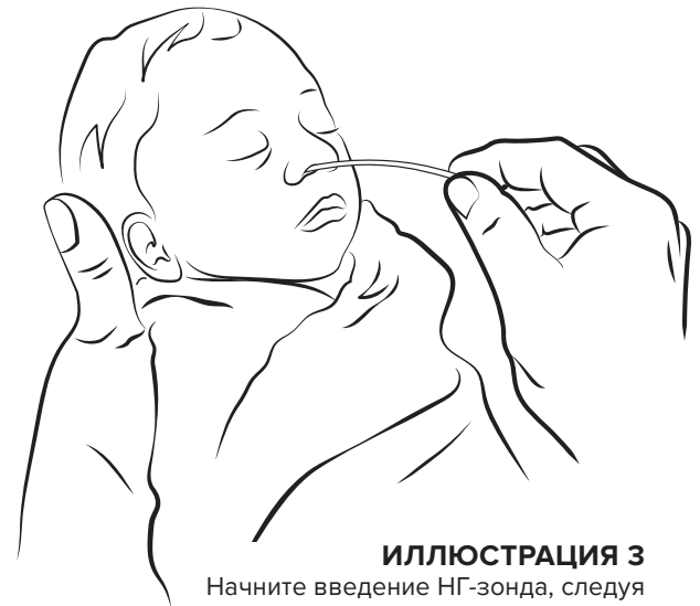
ИЛЛЮСТРАЦИЯ 3 Начните введение НГ-зонда, следуя естественному изгибу носового прохода ребёнка осторожным движением вперёд-назад.